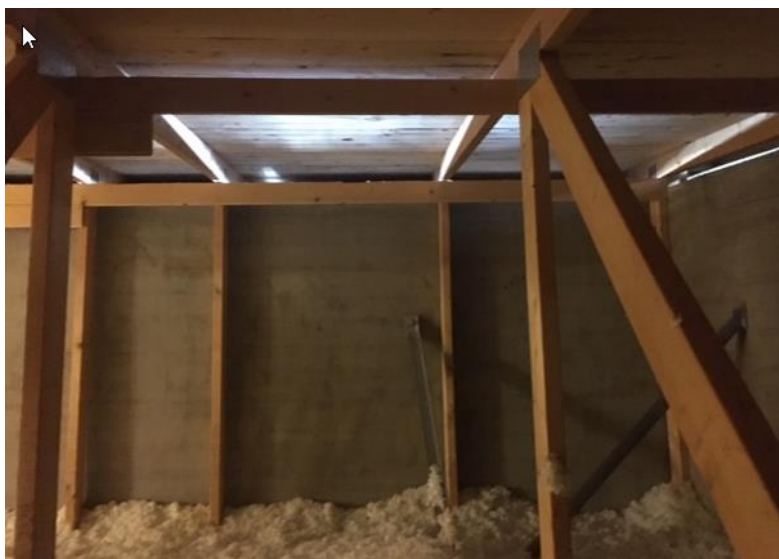
Bild från gavel... glipan mellan 1,5-3cm, saknar nät, visuellt konstaterat.

Byggpartner hävdar korrekt installation, godkänd vid besiktning. (kvarstår som brist) Styrelsens uppfattning att installationen ej är korrekt utförd. Ev. fråga till 5-års slutbesiktning. Punkten stängs tills vidare.